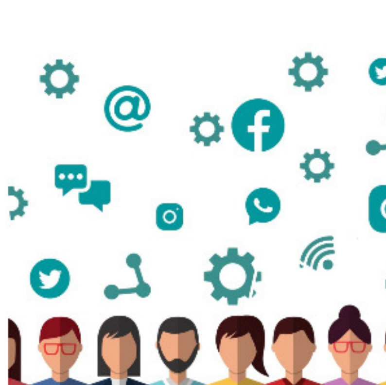
SMARTPHONE D'ORO, PREMIO ITALIANO DEDICATO ALLA COMUNICAZIONE DIGITALE La Redazione | 30 Ottobre 30, 2020